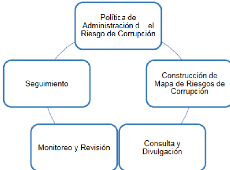
Ilustración 1. SUBCOMPONENTES ESTRATEGIA DE GESTIÓN DEL RIESGO DE CORRUPCIÓN